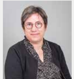
Amélie CHAUDELET 5 ÈME ADJOINTE EN CHARGE DES SOLIDARITÉS ET DU CENTRE COMMUNAL D'ACTION SOCIALE (CCAS)