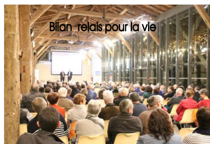
Bilan relais pour la vie