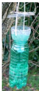
Piège à frelons

Si vous découvrez un nid de frelons asiatiques, signalez-le à la mairie déléguée de Saint-Georges-sur-Layon ou en mairie centrale de Doué-en-Anjou