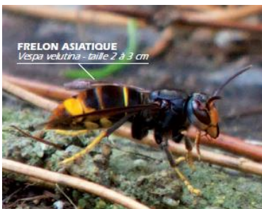
FRELON ASIATIQUE Vespa velutina - taille 2 à 3 cm

La piqûre est douloureuse mais pas plus dangereuse que celle d'une guêpe SAUF pour les personnes allergiques au venin d'hyménoptères qui doivent être très prudentes.